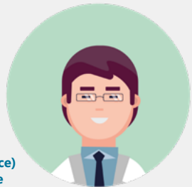
Collaborateur(trice) médecin / interne

A un rôle exclusivement préventif comportant des actions en milieu de travail et le suivi individuel de l'état de santé des salariés lors de consultations médicales afin d'éviter toute altération de la santé des salariés du fait de leur travail